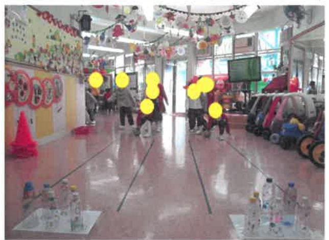
保齡球遊戲新穎又有趣。