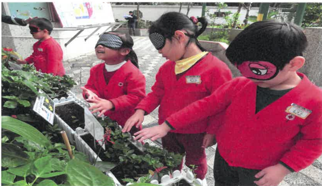
透過感觀刺激，讓幼兒更仔細地欣賞植物。