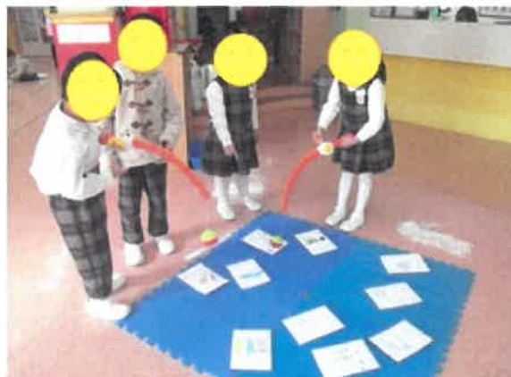
幼兒能以魚竿釣起貼上綠色生活的情境圖卡。