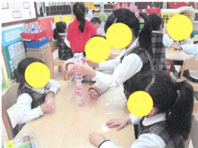
層層疊遊戲多歡樂。